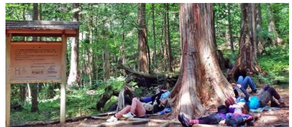
学習旅行のメニュー例（森林セラピーの体験）