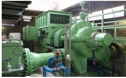
中野西部地区の揚水機場（ポンプ設備）

県営かんがい排水事業 鎖川地区（松本市）では、老朽化していた2か所の頭首工を改修に併せて1か所にまとめ、安定した農業用水の確保及び水管理労力の低減を図りました。