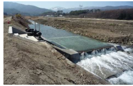
鎖川地区の頭首工