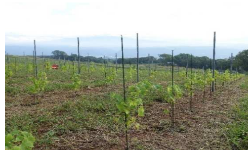
定植されたぶどう苗