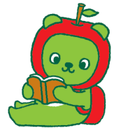
長野県PRキャラクター「アルクマ」 ©長野県アルクマ