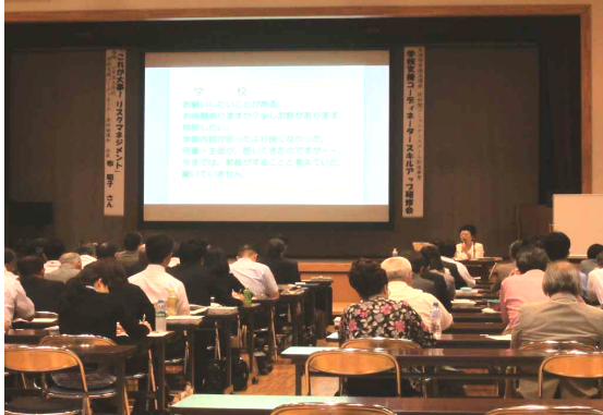
生涯学習推進センターの研修講座

「県民協働による事業改善」の点検を踏まえ、H27年度に生涯学習推進センターのあり方検討を行い、当センターの原点「生涯学習によるまちづくり」に向けて、日本一の公民館活動を支える機関としての更なる機能強化に着手