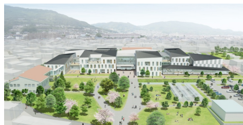
長野県立大学(仮称)イメージ