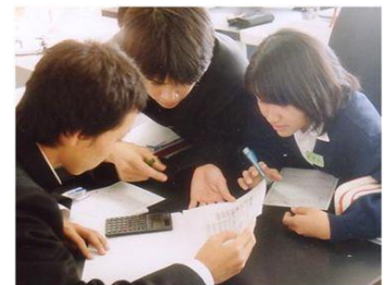
中学生の学び合い