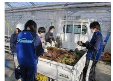
就業体験活動での農園実習