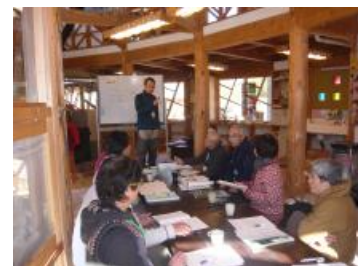
通学合宿リーダー養成セミナー