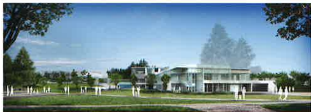
新美術館イメージ©ブランツアンシエイツ