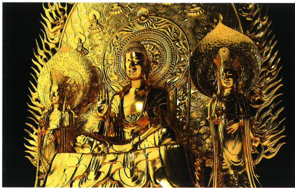
法隆寺釈迦三尊像(復元CG)

新しい美術館の完成にあたり、美術館という施設の本質に関わる、公開と保存・修復・復元をめぐるさまざまな問題について考える展覧会です。東京藝術大学は最新のデジタル技術を駆使し、文化財を「スーパークローン」として、周囲の環境までも含めて精密に復元する技術を確認しました。今回の展覧会では、パーミヤンやキジル、敦煌などの石窟寺院から法隆寺金堂の釈迦三尊像に至るまで、仏教東漸の跡を記す「スーパークローン文化財」を展示し、周囲の環境までも含めて展示することで、近年の地球温暖化による気候の急激な変化や地域紛争の激化により、存亡の危険にさらされている文化財の保護と公開の問題について、新たな視点から考える機会とします。