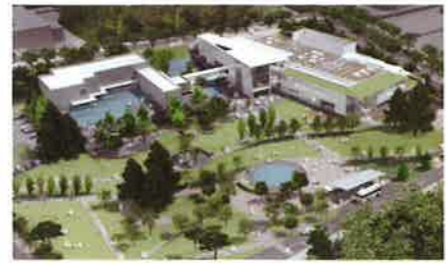
新美術館イメージ©ブランツアソシエイツ

JR長野駅善光寺口バス乗り場①及び ⑦の善光寺経由のバス、もしくは善光 寺行き「びんずる号」で「善光寺大門」 下車(所要時間約13分)、表参道を善 光寺本堂方向に歩き、本堂を右方向、 城山公園へ徒歩10分。