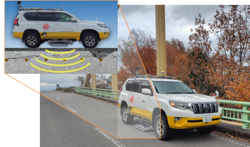
橋梁床版計測イメージ

従来技術では電磁波データの微細な色調変化を、技術者の経験により判断していましたが、本技術では機械学習分析手法を用いることにより、損傷部と健全部の定量的な評価が可能となりました。国土交通省の標準試験では、全体での検出率89%、的中率56%と高い検出精度が実証されました。