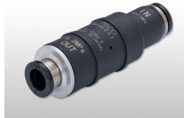
(製品外観写真) 特許第7009525号