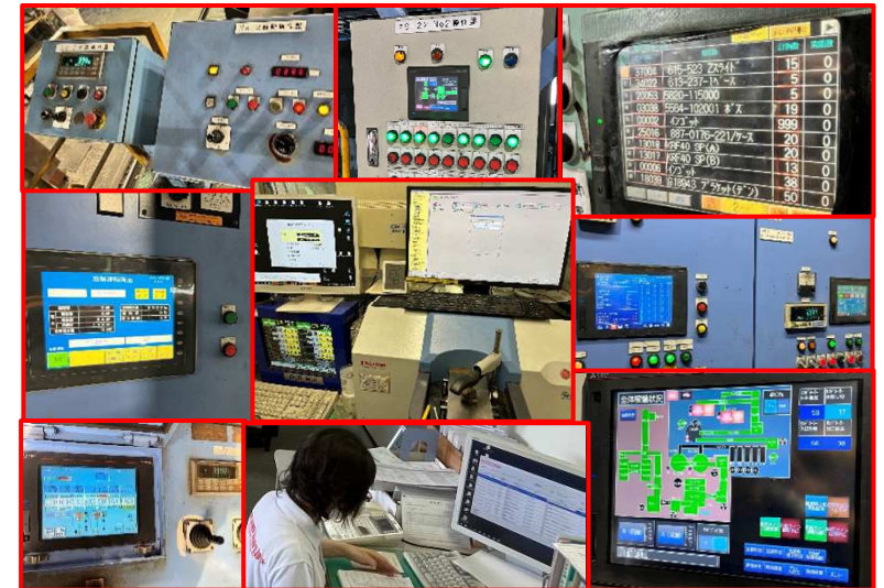
設備・機器・ファイルなどに散らばった情報

鑄造事業を営む当社が独自開発した各工程の情報を自動収集・見える化するシステムです。日々の受注出荷状況や生産ラインのシーケンス現在値をリアルタイムに把握することで、素早い対応が可能になり、生産ロスを徹底的に省く事で納期短縮による顧客満足度にも寄与し、新規受注の増加にも貢献しました。また、開発は敢えてエクセルだけで制作したことで、誰でも使え、他業種にも応用できるものになっています。