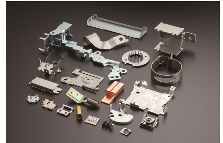
精密板金試作サンプル