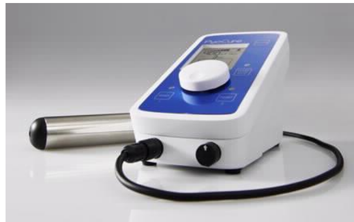
パイオキュアー 本体

イオン導入法で処置を行うと単純塗布より58%多くフッ素が取り込まれ、脱灰は32%少ないという実験結果があり、一般的な単純塗布法よりも優位性がある。全国の歯科医院はもちろん、北九州市などの官公庁では市内の小学生を対象に集団予防として本製品を使用している。