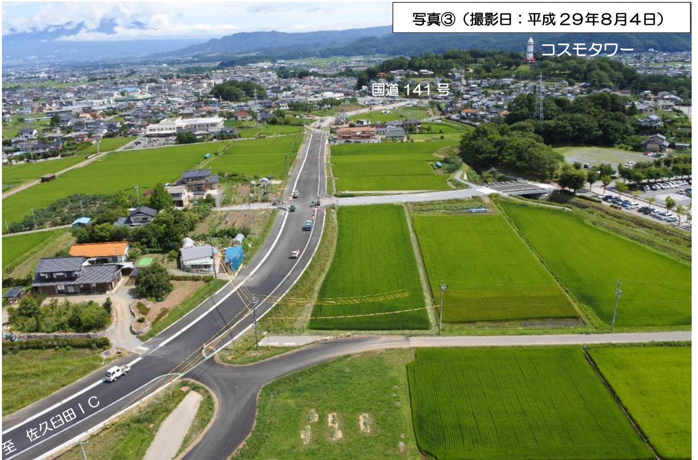
写真③ (撮影日:平成 29年8月4日)