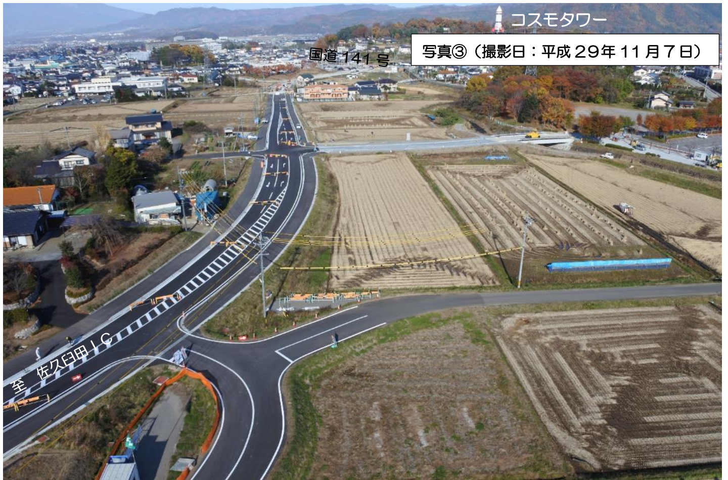
写真③ (撮影日:平成 29年 11月 7日)