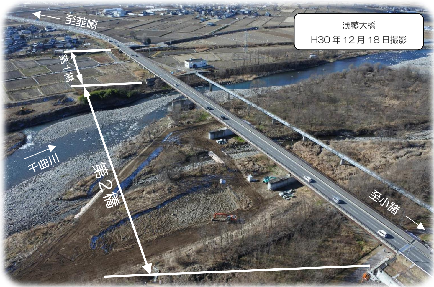
浅夢大橋 H30年12月18日撮影