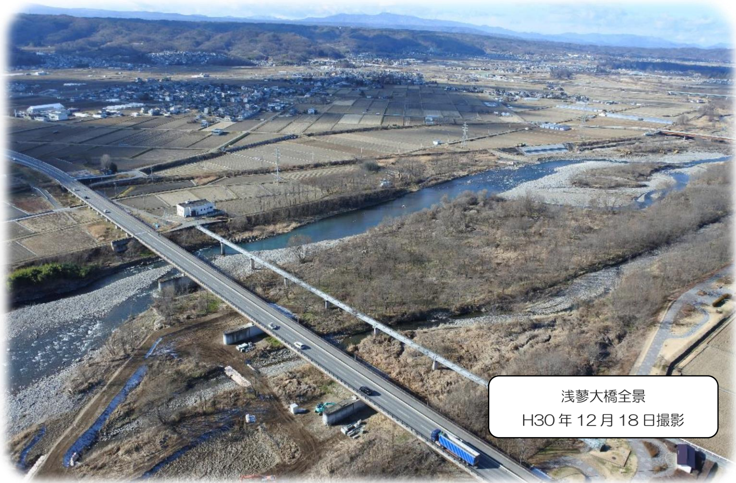
浅夢大橋全景 H30年12月18日撮影