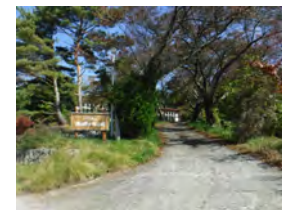
天池総合グラウンド