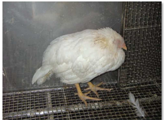
高病原性鳥インフルエンザウイルスに感染し、元気をなくしている鶏

➤ 鶏に元気がない場合やほぼ同時期に複数羽が死ぬ場合は、すぐに獣医さん（家畜保健衛生所、動物病院）に相談して、治療や指示などを受けましょう。