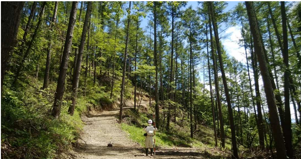
小海町豊里 間伐 作業道開設