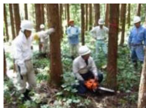
住民協働の森林整備