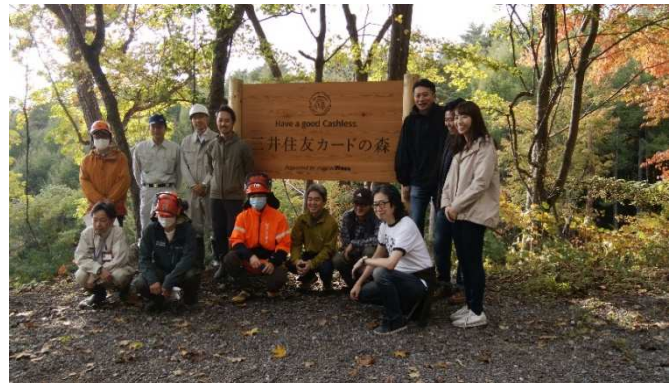
調印式後の記念植樹 (R2 三井住友カード・モアトゥリーズ・小諸市)