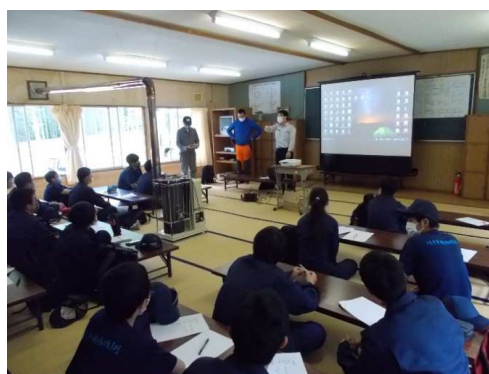
伐倒・玉切り講習会