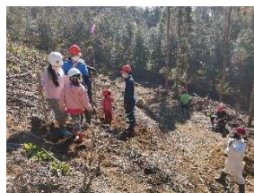
森づくり（植林活動）