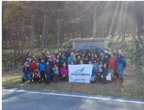
企業(社員)による森林整備体験 (R2 郵船ロジステック・立科町)