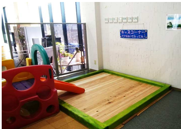
長野トヨタ自動車株式会社小諸店に設置された キッズコーナー