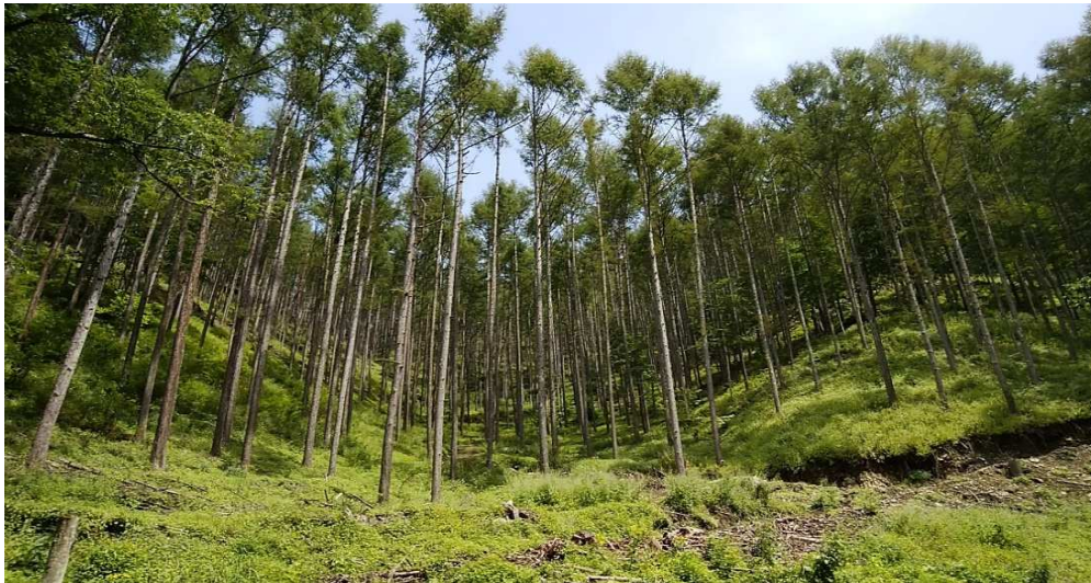
南相木村上栗尾 間伐 作業道開設