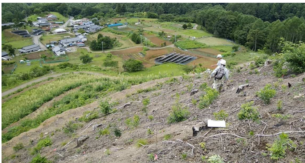
佐久穂町穂積 植栽 (林野火災跡地)