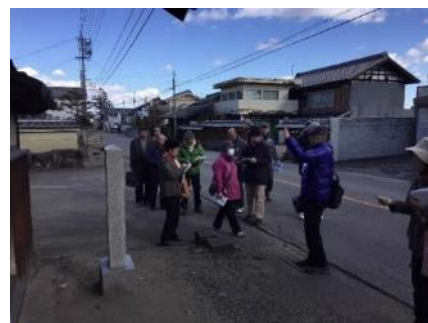
【ガイド養成講座の様子】