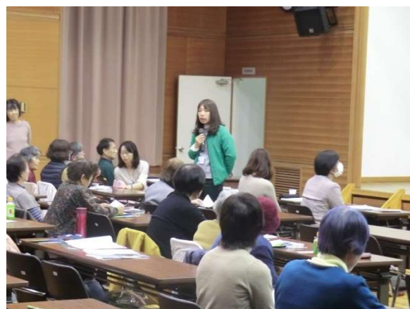
参加者全員による意見交換会