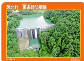
筑北村 東条砂防堰堤