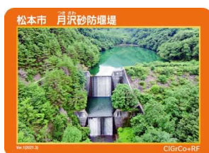
松本市 月沢砂防堰堤