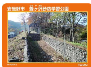
安曇野市 蜂ヶ沢砂防学習公園