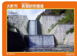
大町市 長畑砂防堰堤