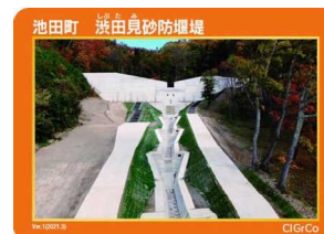
池田町 渋田見砂防堰堤