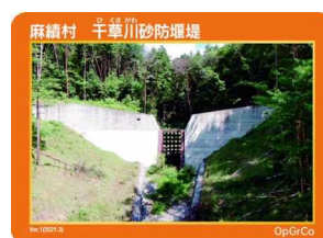
麻績村 千草川砂防堰堤