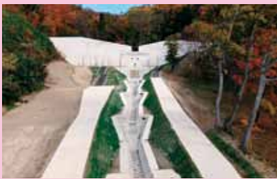
しぶたみ さ ぼうえんてい ⑦渋田見砂防堰堤