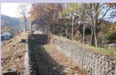
はちがさわ さ ぼうがくしゅうこうえん ②蜂ヶ沢砂防学習公園