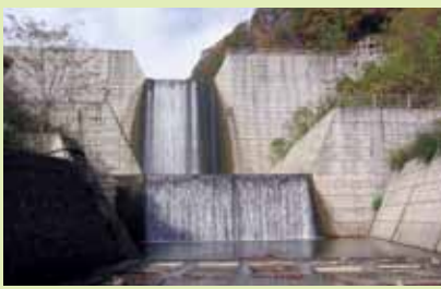
ながばたけ さ ぼうえんてい ⑥長畑砂防堰堤