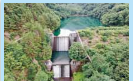
つきさわ さ ぼうえんてい ①月沢砂防堰堤