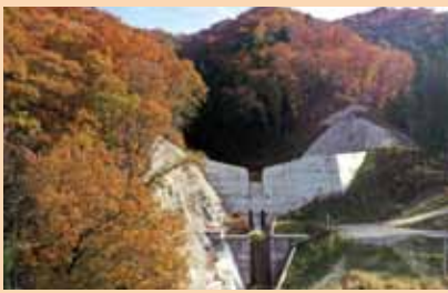
おおばやしざわ さ ぼうえんてい ④大林沢砂防堰堤