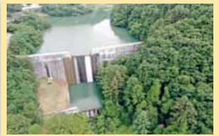
ひがしよし さ ぼうえんてい ⑤東条砂防堰堤