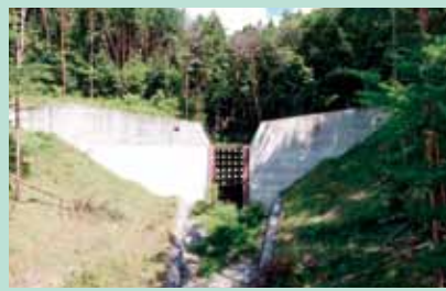
ひくさがわ さ ぼうえんてい ③干草川砂防堰堤