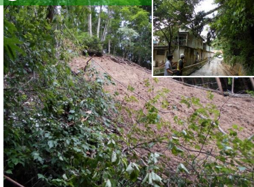
【被害状況等】人家一部損壊、1世帯自主避難