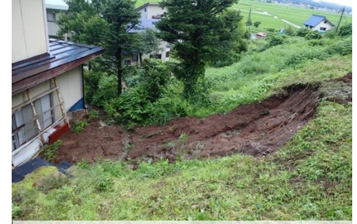
【被害状況等】人的被害なし、17世帯避難