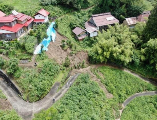
【被害状況等】人的被害なし