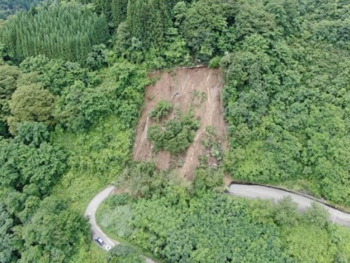
【被害状況等】村道埋塞、1世帯自主避難