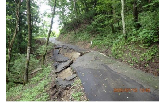
【被害状況等】村道崩落