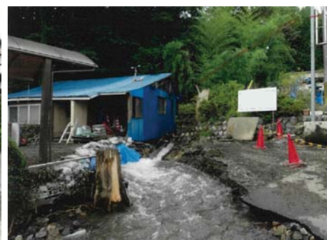
⑬ 箕輪町 富田(土石流)