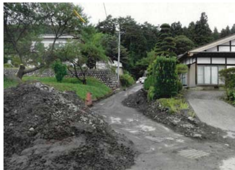
⑫ 箕輪町 下古田北(土石流)