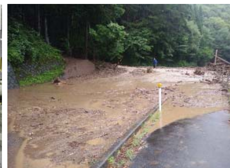
⑭ 木曾町 梨子ノ木沢(土石流)