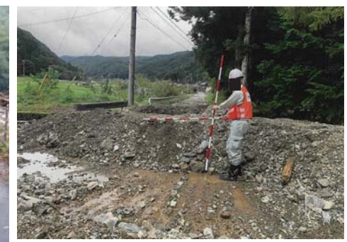
⑯ 辰野町 下飯沼沢(土石流)