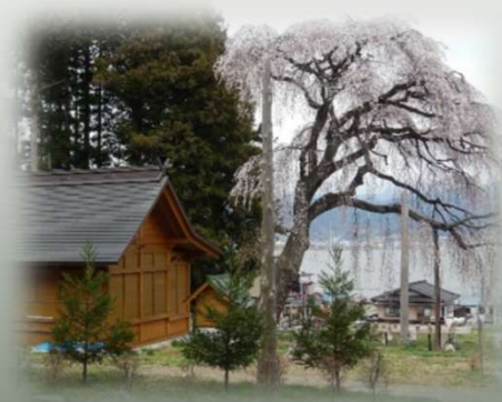
船魂社のシダレザクラ(岡谷市)