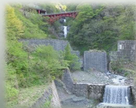
蒲原沢土石流災害(小谷村)