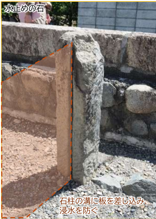
石柱の溝に板を差し込み、 浸水を防ぐ