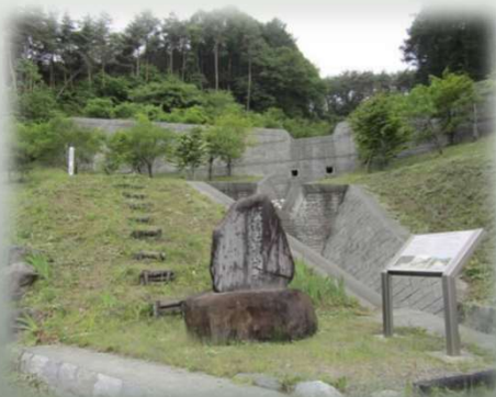
赤羽災害伝承碑(辰野町)