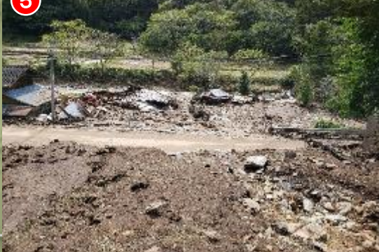
10/12 土石流 佐久穂町大日向 古谷 【被害状況】全壊1戸、半壊1戸