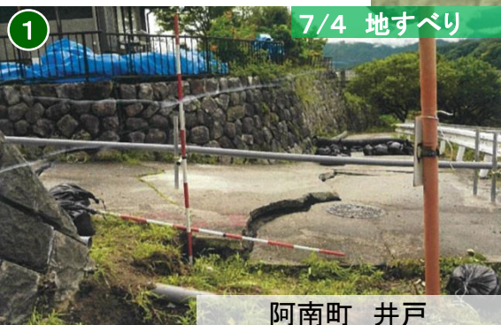
7/4 地すべり 阿南町 井戸