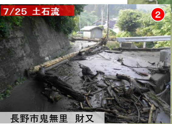
7/25 土石流 長野市鬼無里 財又