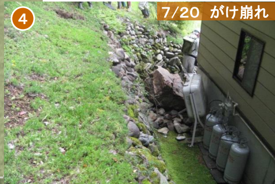
7/20 がけ崩れ 上田市 武石上小寺尾