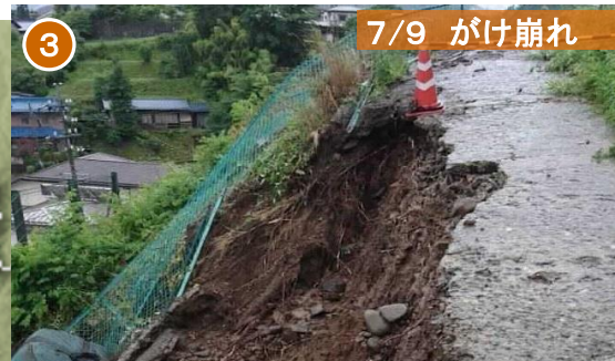
7/9 がけ崩れ 岡谷市 山手町 急傾斜地崩壊対策施設が崩落土を捕捉