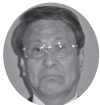
さかきばら たけし 榊原 剛