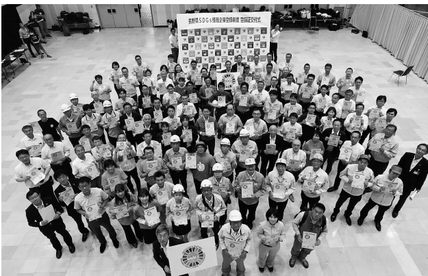
参加者全員で登録証を手に記念撮影

（県ホームページ） https://www.pref.nagano.lg.jp/sansei/tourokuseido.html