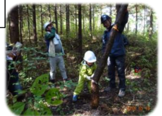
森林環境教育（除伐体験）