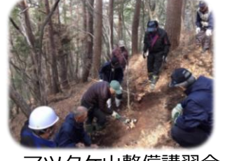
マツタケ山整備講習会