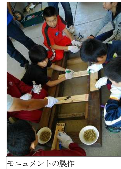
モニュメントの製作