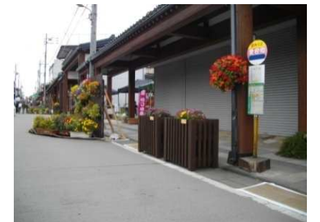
木製プランターの設置状況