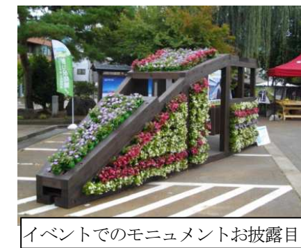
イベントでのモニュメントお披露目