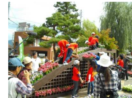
イベントでのモニュメント飾り付け