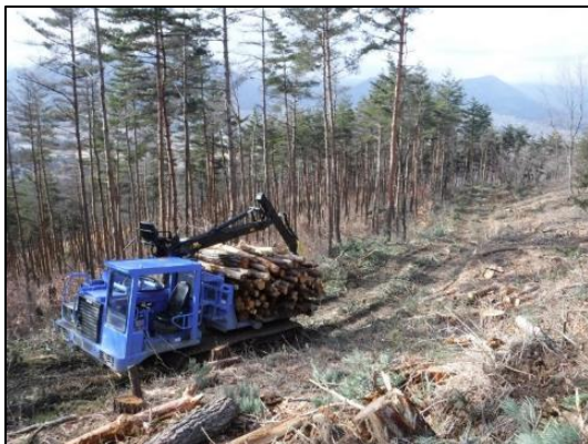
被害材の搬出状況 上田市