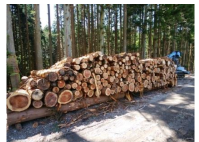
【南木曾町 搬出・集積状況】