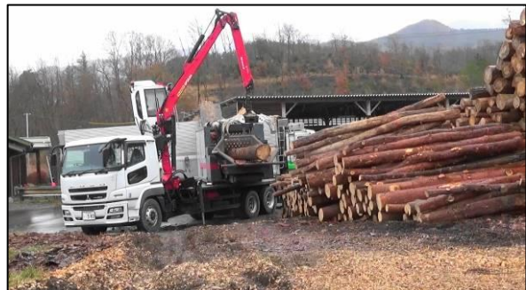
被害材のチップ化状況 松本広域森林組合