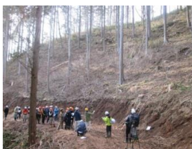
上伊那地域の取組状況 (12/15)