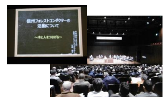
SFC情報発信 木と緑のフォーラムin信州うえだ (2/6)