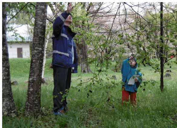
社員、社員家族による森林整備及び森林学習等 【JXTGエネルギー(株)と原村】（平成29年5月実施）