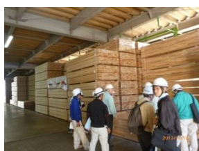
松本地域の取組状況 (11/10)