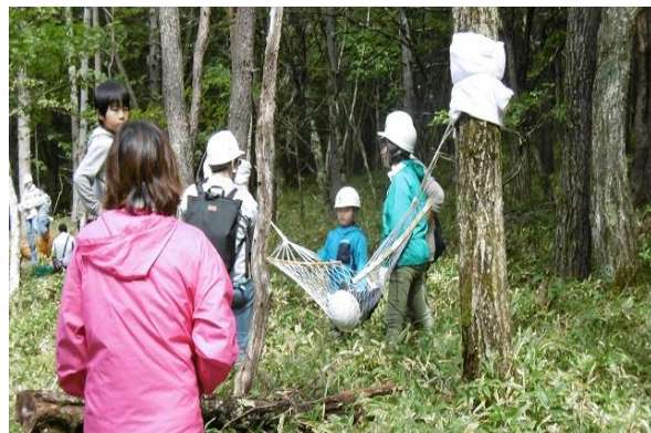
社員、社員家族による森林整備及びレクリエーション 【長谷エコーポレーション(株)と茅野市七ヶ耕地財産区】（平成29年9月実施）