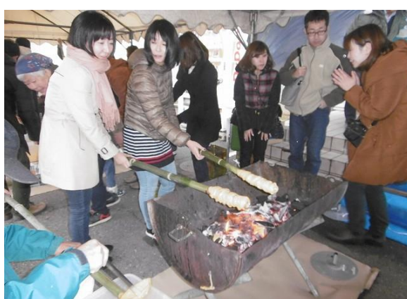
契約記念式典と社員、社員家族による里親受入イベント 【損害保険ジャパン日本興亜(株)と松本市寿財産区】（平成29年11月契約）