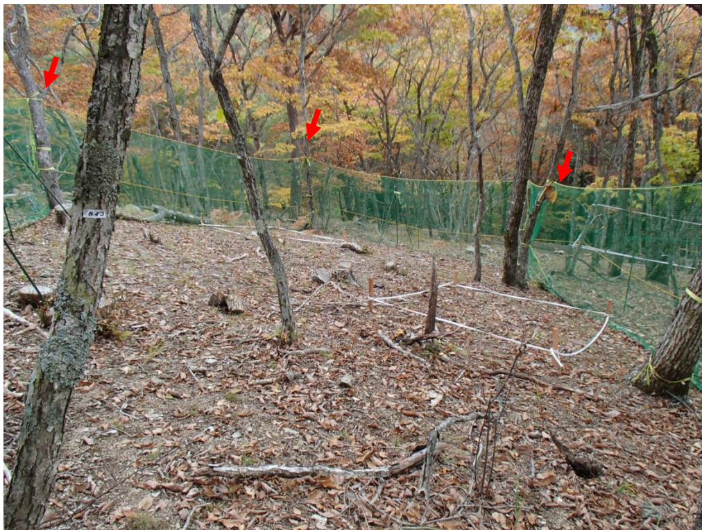
立木仕様(H=2.0m 全長L=150m) 赤矢印：立木使用位置