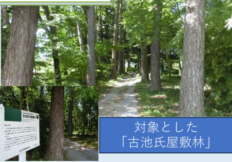
対象とした「古池氏屋敷林」

天保5年(1834)から安政3年(1855)にかけて新田開発を進めた古池新田村（現松本市古池）に、事業に関わった古池氏の屋敷林が存在。