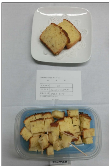
写真1 上が展示用。下が試食用

※ 展示用（写真撮影用）の食器は御持参ください。試食用は会場にある食器を使用できます。