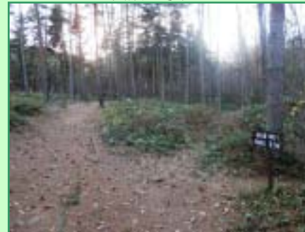
マレットゴルフ場