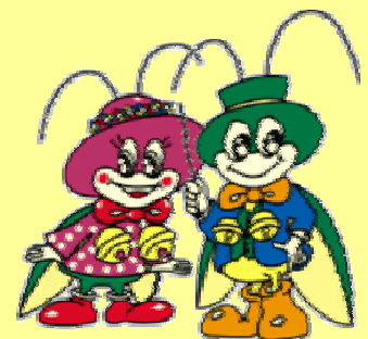
松川村のマスコットキャラクター りんりんちゃん&りん太くん