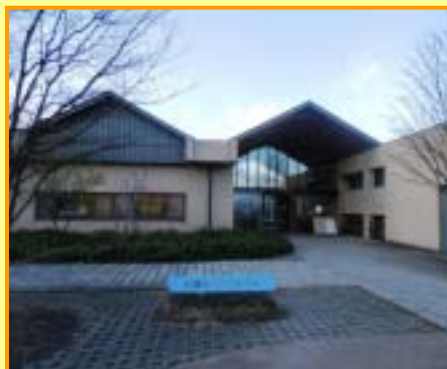
安曇野ちひろ美術館