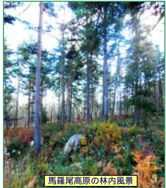
馬羅尾高原の林内風景