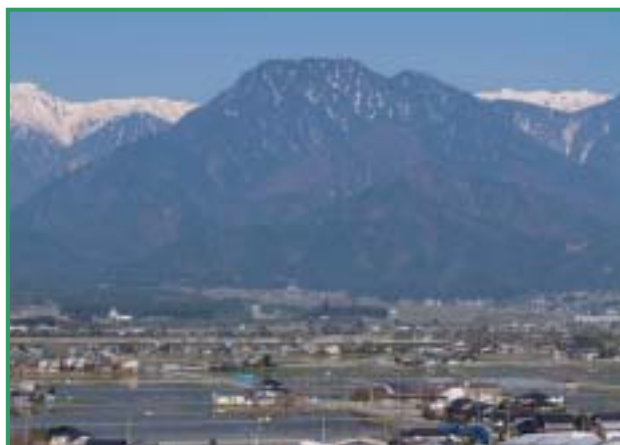
有明富士の雄姿と安曇野田園風景

中央道・上信越道・関越道・長野道の各高速道路ご利用で、豊科I.Cから国道147号線を北上。豊科I.C.から松川村まで約20分。