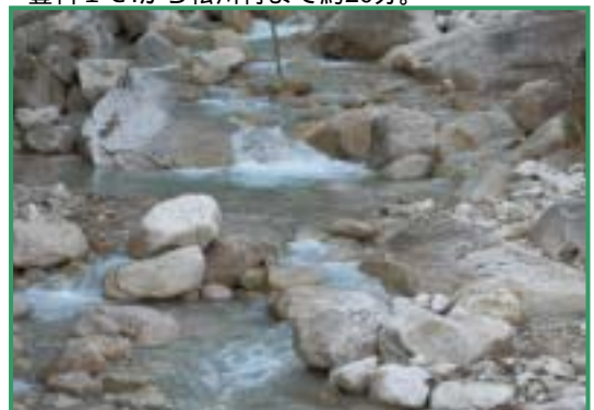
馬羅尾高原を流れる芦間川の清流