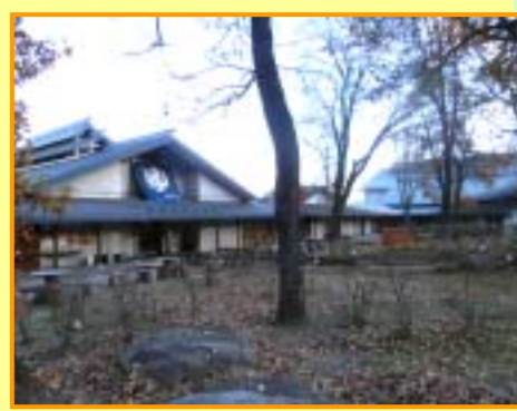
馬羅尾天狗岩温泉すずむし荘