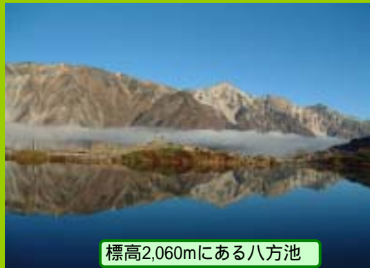
標高2,060mにある八方池