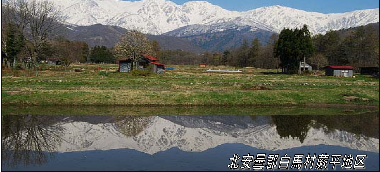
北安曇郡白馬村蕨平地区