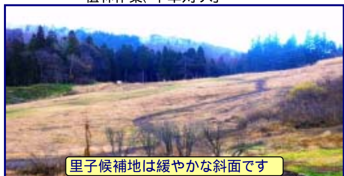
里子候補地は緩やかな斜面です