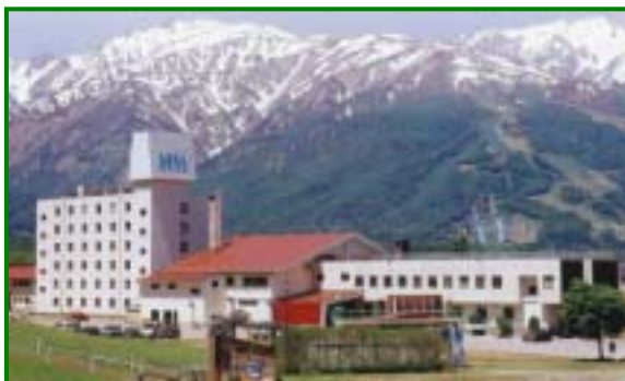
里子候補地のすぐそばにある「白馬ハイランドホテル」