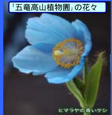
ヒマラヤの青いケシ