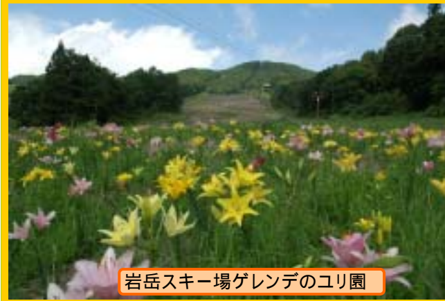
岩岳スキー場ゲレンデのユリ園