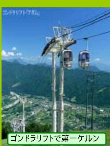
ゴンドラリフトで第一ケルン