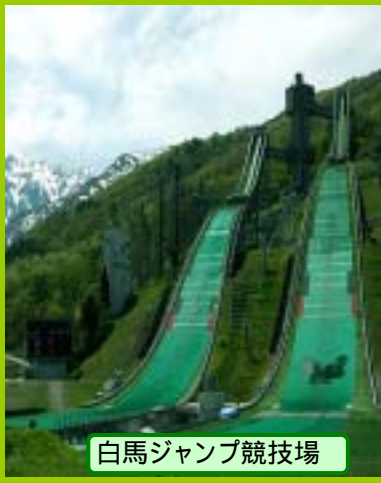
白馬ジャンプ競技場