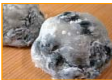
黒豆『信濃黒』を使ったこんにやくと大福餅