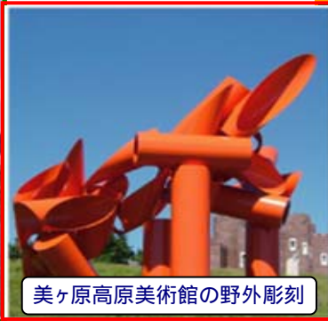
美ヶ原高原美術館の野外彫刻