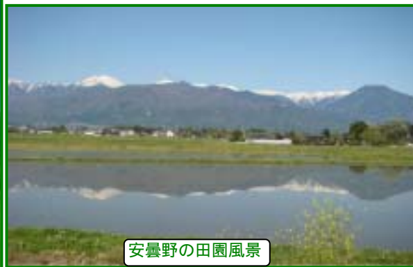
安曇野の田園風景