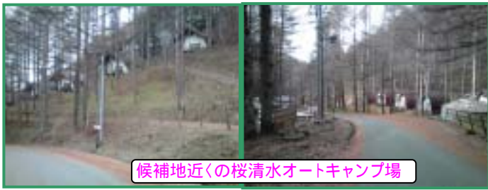
候補地近くの桜清水オートキャンプ場