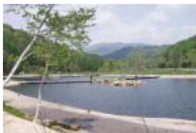
平谷湖フィッシングスポット