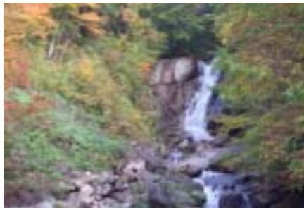
紅葉に彩られた平谷大滝