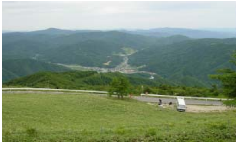
高嶺山頂上より平谷村中心部の全景

平谷村へは夏の涼しさを求め中京圏から多くの観光客が訪れており、その為の受け入れ施設として「ひまわりの湯」を中核として様々な施設が国道沿いの一ヶ所に整備されており、夏になりますと道の駅周辺でひまわりの花が咲きます。