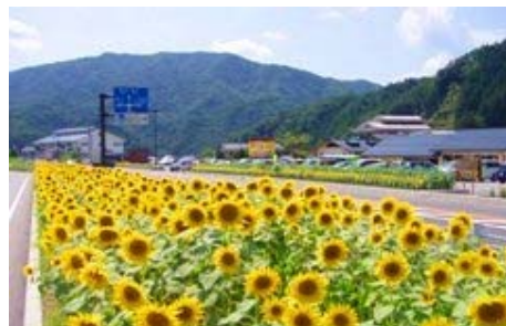
平谷村の象徴 ひまわり