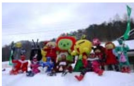
珍珍幕府 冬の陣 (平谷高原スキー場)