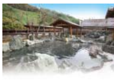
温泉施設ひまわりの湯 露天風呂