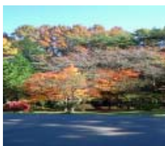
構内ステーション

キャンパスから車で30分中央アルプス将棋頭山の懐にあるステーション、入り口付近には30人収容可能な宿泊施設を備えております。