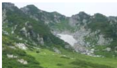
中央アルプス千丈敷カールの夏