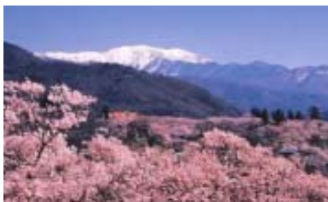
高遠の桜と南アルプス仙丈ヶ岳の残雪