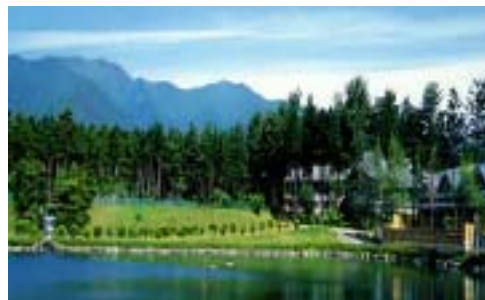
信州大芝公園みんなの森