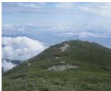
西駒ステーション

キャンパスから車で30分中央アルプス将棋頭山の懐にあるステーション、入り口付近には30人収容可能な宿泊施設を備えております。