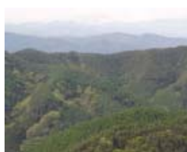
手良沢山ステーション

多種多様な樹種からなる里山であり森林環境などの多目的教育研修の利用が可能であり近くには数多くの宿泊施設があります。