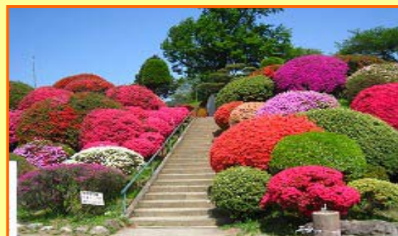
【つつじで有名な鶴峯公園】