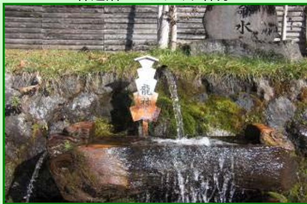
林道沿いにある【長命の水】