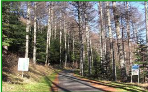
林道沿いのカラマツ林分

所在地・・・長野県岡谷市字横川 所有・・・横川山運営委員会の山林1,750ha 現況林分・・・カラマツ主体の人工林 森林体験・・・林道沿いの除伐・ヒノキ枝打ち等