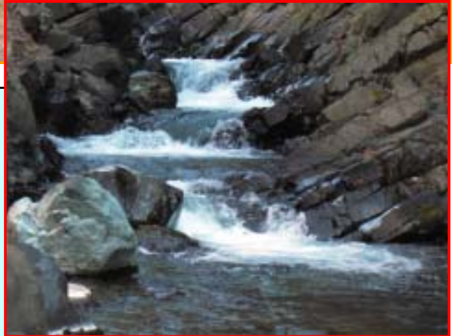
水源となっている横河川の清流

21世紀は、「環境の世紀」、「水の世紀」とも言われている。健全な森林整備を行って、将来にわたり水の源を守っていきたい。