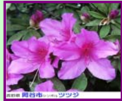
長野県 岡谷市 横川山 ツツジ