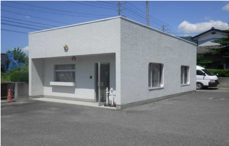
①警察学校模擬交番