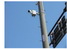
長野県警察街頭防犯カメラ設置促進事業