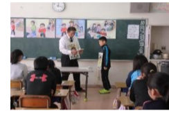
スクールサポーターによる非行防止教室