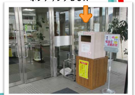
千曲署の正面玄関(風除室)