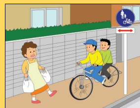
歩道通行時の 通行方法違反