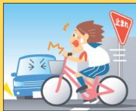
一時停止場所不停止