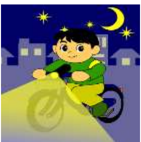
夜間はライトを点灯