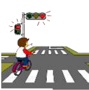
交差点での信号遵守と 一時停止・安全確認