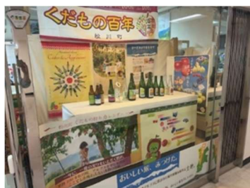
松川町 くだもの百年展示

展示をご希望、お考えの皆様は、お気軽に長野県大阪事務所・大阪観光情報センターへご連絡ください。