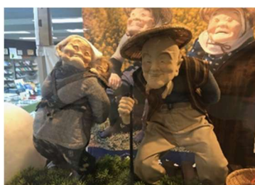
飯山市 高橋まゆみ人形館展示