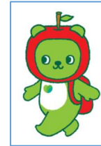
長野県 PR キャラクター「アルクマ」 ©長野県アルクマ

長野県大阪事務所・観光情報センター Report Letter Vol.44 (2026.1.9)