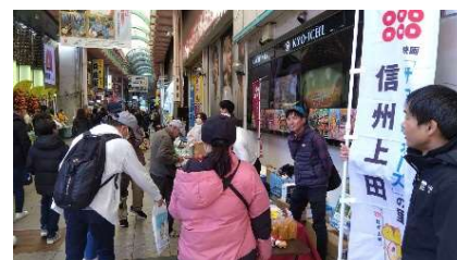
昨年、上田市参加の様子

全国各地のアニメゆかりの地が集合し、各地の魅力を PR。長野県からは千曲市がゆかりアニメ作品「Turkey !」の紹介とともに、聖地巡礼マップや観光パンフレットの配布、ポスター・サイン等の展示、スタンプラリーの P R により千曲市の観光情報を発信。