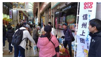
昨年、上田市参加の様子

全国各地のアニメゆかりの地が集合し、各地の魅力を PR。長野県からは千曲市がゆかりアニメ作品「Turkey！」の紹介とともに、聖地巡礼マップや観光パンフレットの配布、ポスター・サイン等の展示、スタンプラリーの P R により千曲市の観光情報を発信。