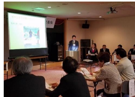
【農業青年プロジェクト活動・意見発表会】