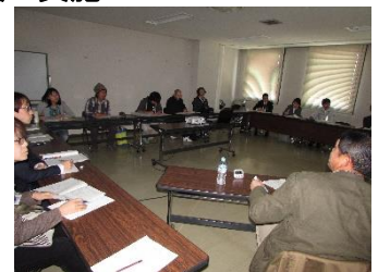
【里親研修生集合研修】