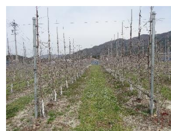
【りんご新しい化栽培】