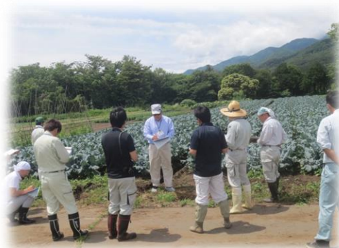
【ブロッコリー共進会】