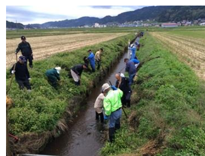
【地域ぐるみでの水路の泥上げ】