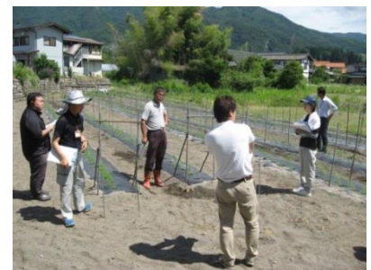
【アスパラガス栽培の巡回指導】