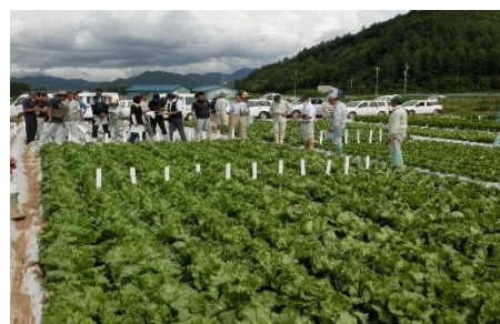
【レタス有望品種現地検討会】