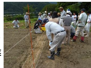
【電気柵設置講習会】