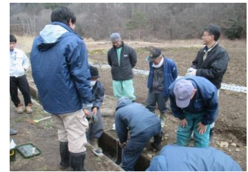
【多面的機能支払事業 水路補修研修】