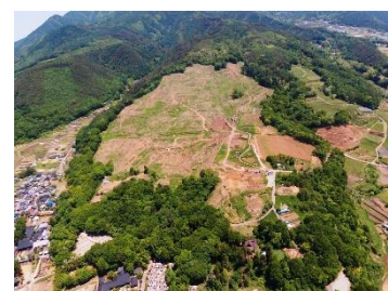
【ワイン用ぶどう生産団地の造成】