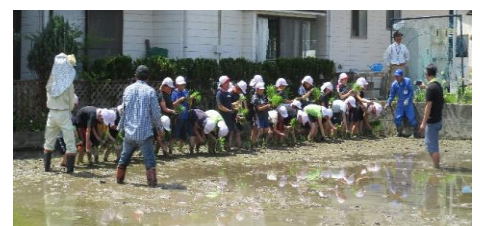
【夢かなえ隊による田植体験（飯田市）】