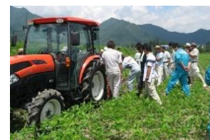
【大豆除草剤試験の検討会】