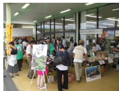
【南信州伝統野菜フェア】