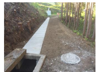
【水路改修工事(木曾町)】