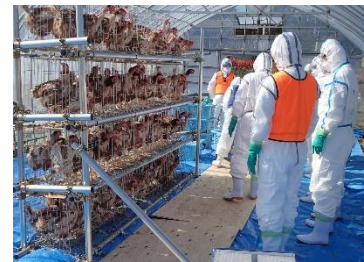
【高病原性鳥インフルエンザ防疫演習】