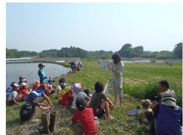
【なんでも体験隊で田植え】