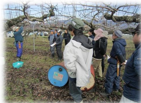
【なし「サザンスイート」研修会】