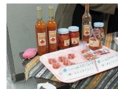
【北アルプス山麓ブランド認定品のトマトジュース】