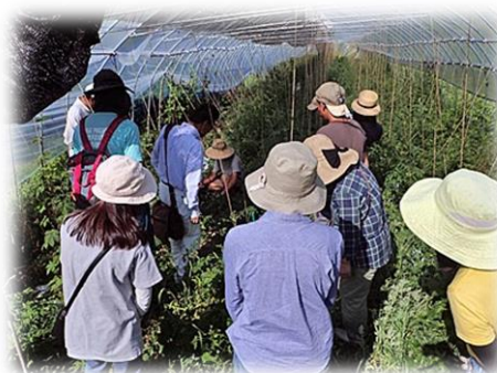
【新規就農実践塾基礎コース】