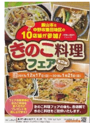
【きのこ料理フェア】