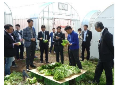
【生産農家を巡るバスツアー】