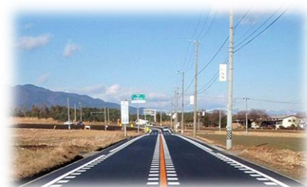
【農道整備事業】 路面改良を行った広域農道 伊那西部2期地区