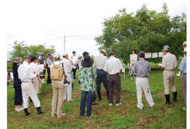
【くるみ防除講習会】