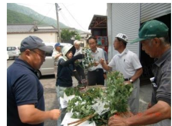
【ヒペリカム目揃い会】