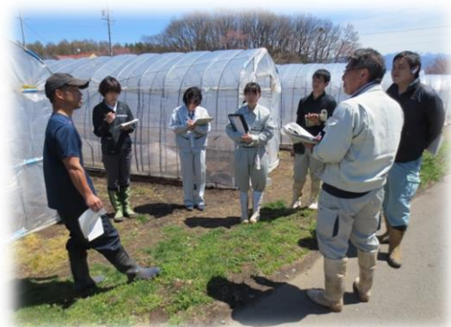
【アスパラガス生産者の巡回】