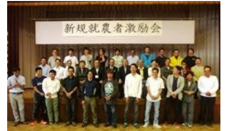
【新規就農者激励会】