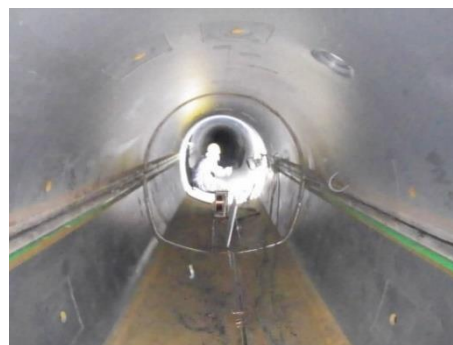
【水路トンネルの補強工事】