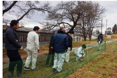
【電気柵設置研修会】