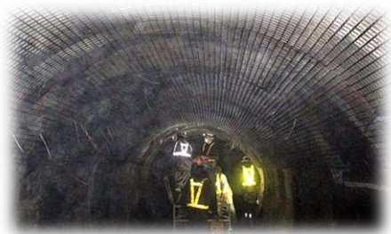
【県営かんがい排水事業】 改修工事中の水路トンネル 西天竜地区