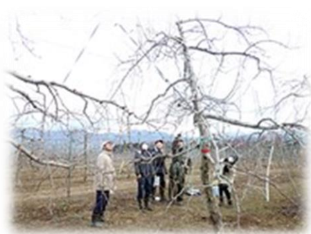
【新規就農実践塾りんご専門コース】