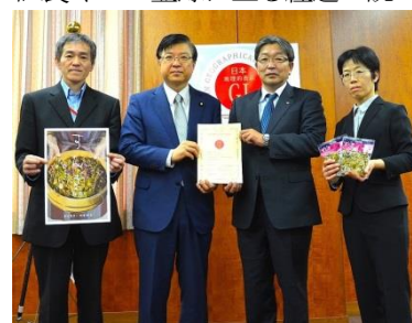
【すんきのGI認定証授与式】