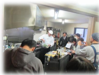
【ガレットキャラバン】