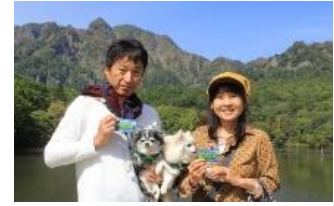
【信州ため池カード・スタンプラリー】