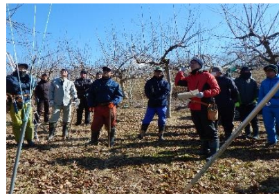
【リンゴシナノリップせん定研修会】