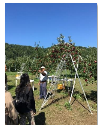
【北信州めぐりツアー】