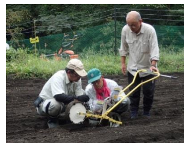
【農業入門講座(赤かぶ播種)】