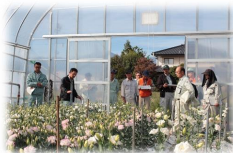
【集落営農組織を対象としたトルコギキョウ現地検討会】