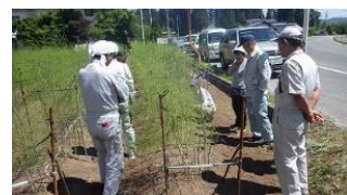
【アスパラガスセミナー】