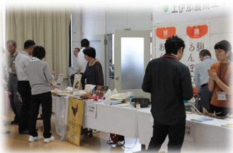
【農商工マッチング交流会】