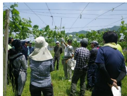
【北信州農業道場ぶどうコース】