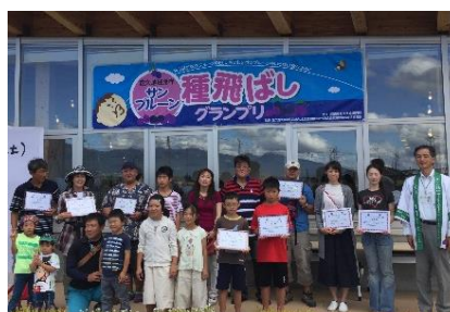
【サンブルーン種飛ばしグランプリ 2017】