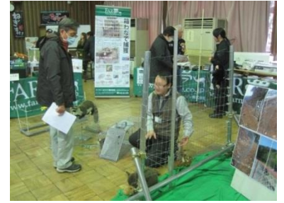
【南信州野生鳥獣被害対策アカデミー（第9回）「対策用品大展示会」】