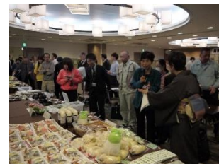
【信州の伝統野菜フォーラム】