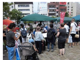
【おいしい信州ふードのPR】