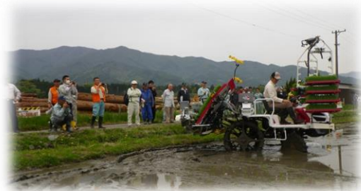
【高密度播種育苗・現地検討会】