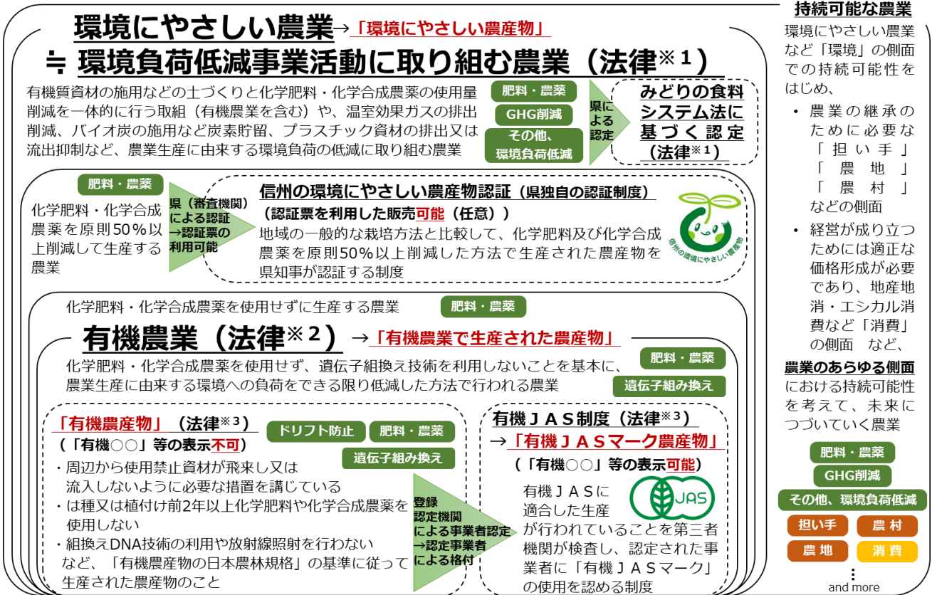
図 1. 長野県農業における環境にやさしい農業等の概念図