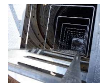
集水井ステップの更新