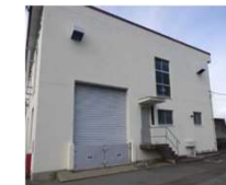
浸水を防止するための対策（止水板）