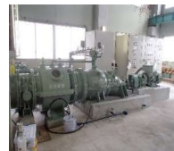
更新が完了した排水ポンプ