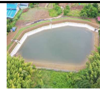
防災工事を実施したため池