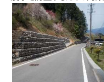
法留工及び横孔ボーリングの孔口保護の更新