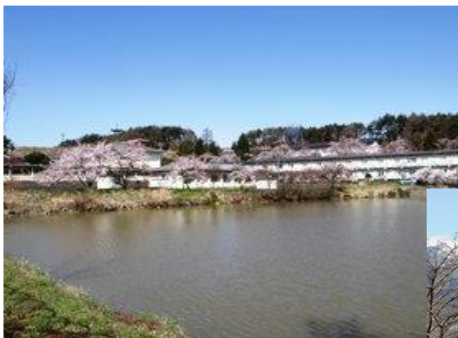
—農大池から見た春の「みまき」の遠景—