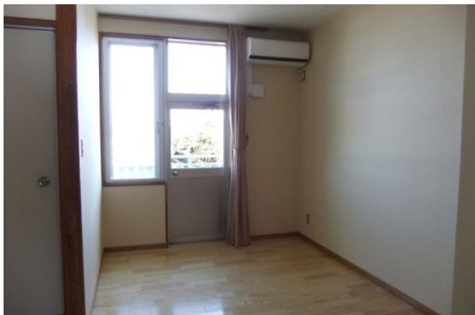
ワンルームタイプの単身用居室 (全室エアコン完備です)

① 単身用・・・ワンルームタイプ：洋室(7畳)、キッチン(IH)、バストイレ、収納