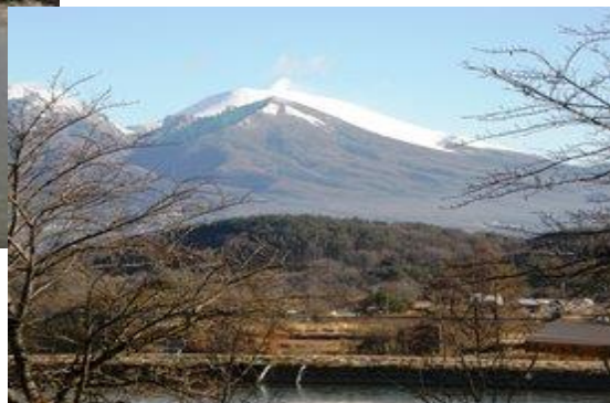
—農大から望む初雪のころの浅間山—