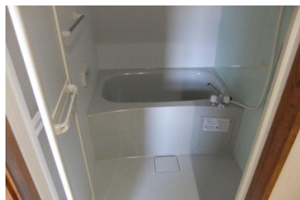
トイレとは別の専用バス