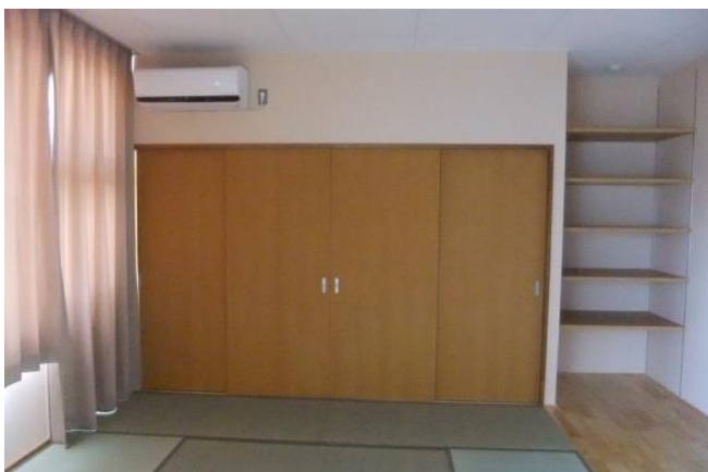
和室 (大きな収納も完備) * 手前側に洋室があります

② 世帯用・・・洋室1間 (7畳)、和室1間 (10畳)、キッチン (IH)、バス、 トイレ、収納